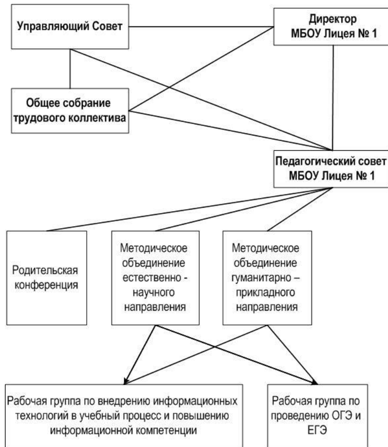
Рисунок 1 – Система управления МБОУ Лицеум №1